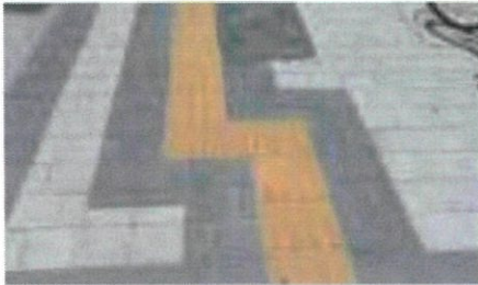
장애물 우회 설치(X)